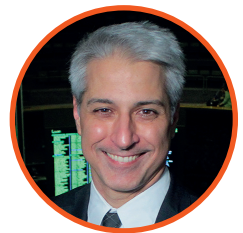
ALESSANDRO MOLON Congressman

Another Brazil is possible. Our time is here!